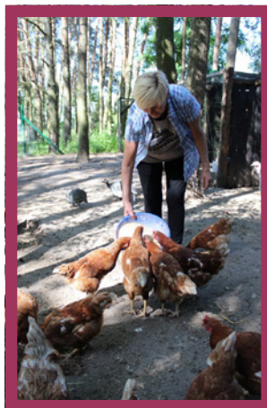
Photo. Granja escuela "Gzinianka", PL